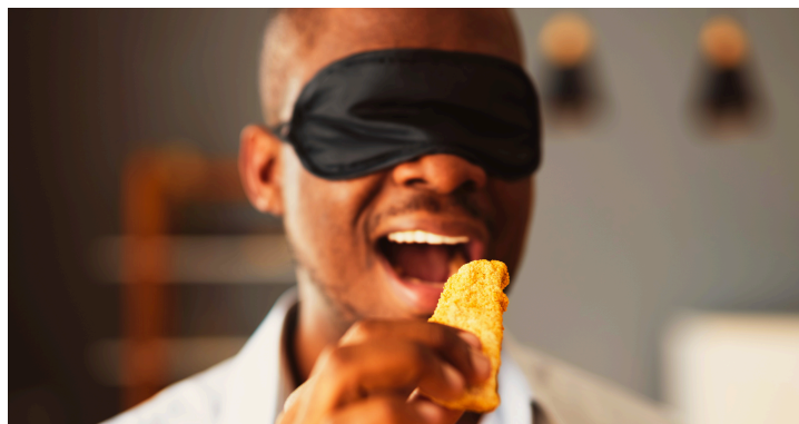
• مسابقة التذوق